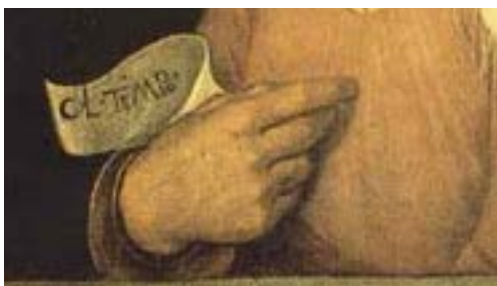
Giorgione, La Vecchia (détail), vers 1500, Galerie dell'Accademia, Venise